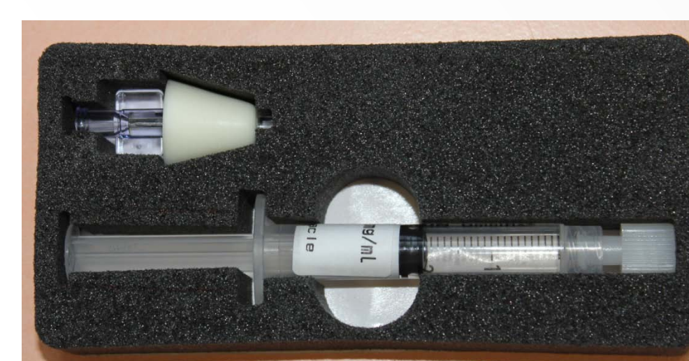
Figures 1 et 2 – présentation provisoire du produit prêt avec mode d'emploi; l'emballage primaire définitif sera en plastique thermoformé