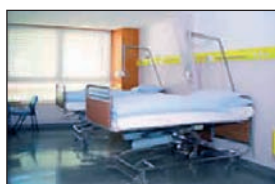
Chambre de patients

L'Hôpital régional de Martigny-Entremont boucle sa dernière année en tant qu'hôpital de district. Dès le 1er janvier 2004, l'Hôpital de Martigny-Entremont rejoint le Réseau Santé Valais et constitue, avec les établissements de Sion, de Sierre et le CVP, le Centre Hospitalier du Centre Valais (CHCVs).